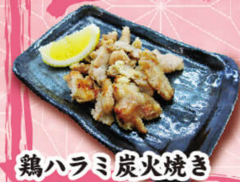
鶏ハラミ炭火焼き