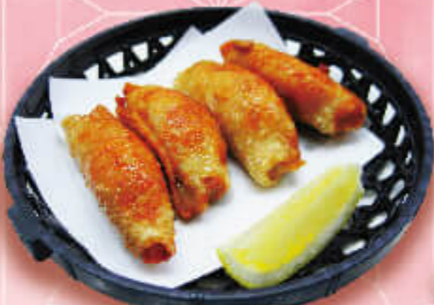
キュアのやみつき 鶏皮餃子