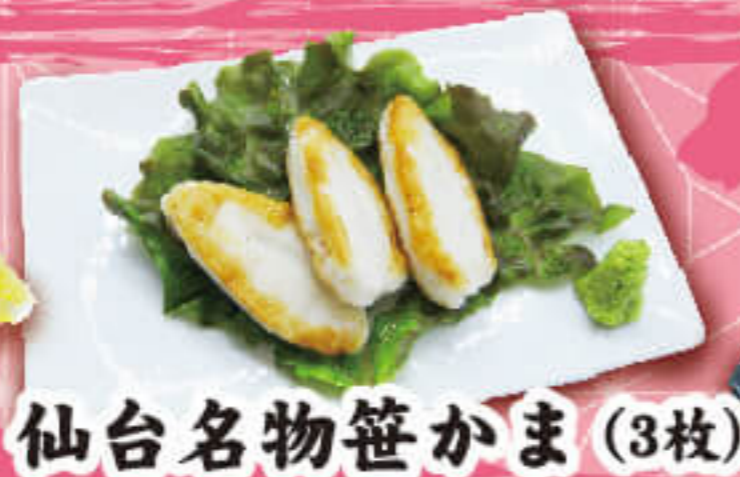
仙台名物笹かま (3枚)